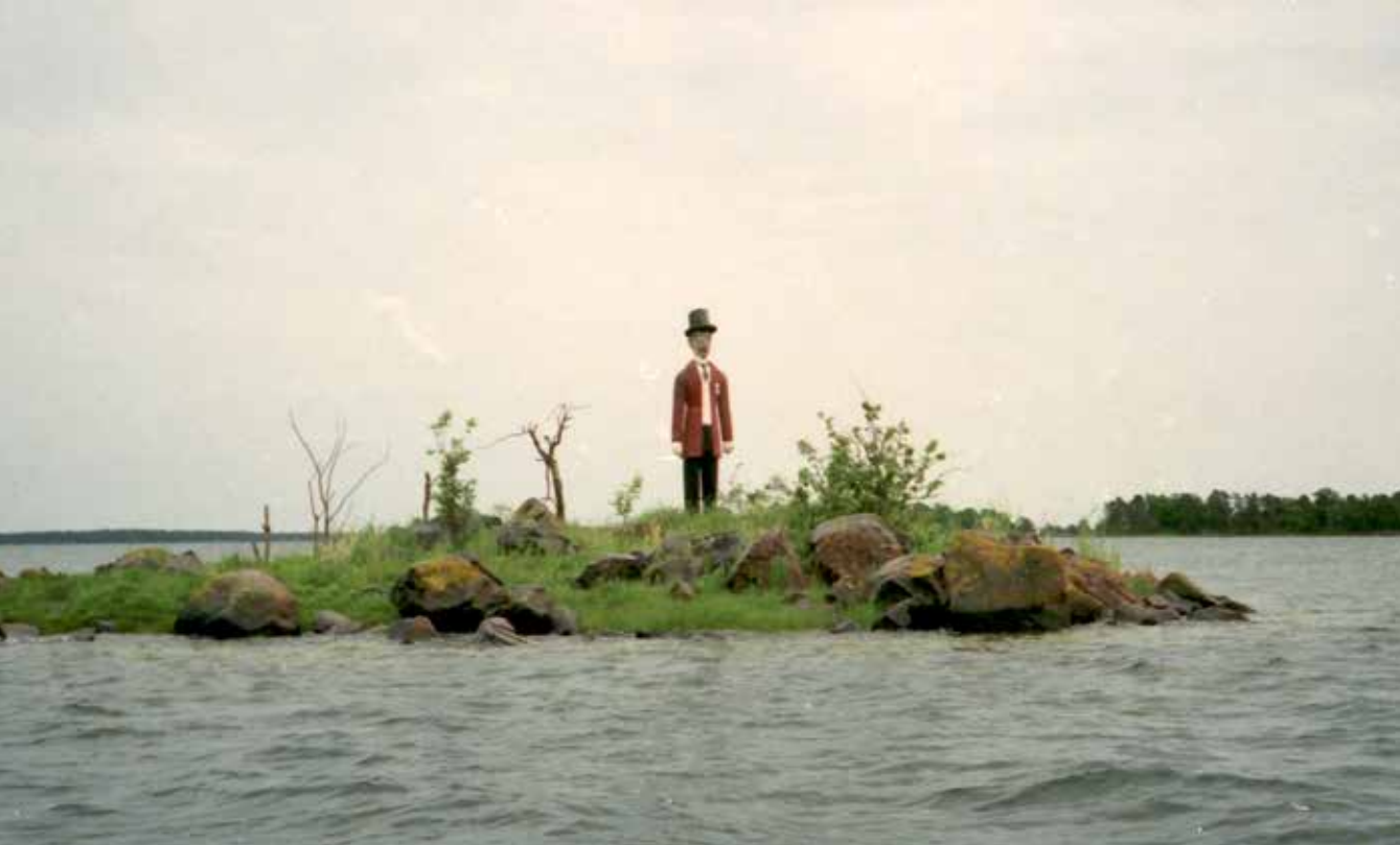
Påskallavik och Storö.